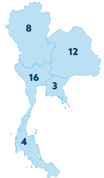
จำนวนโครงการแบ่งตามภูมิภาค

อิมแพคโซลาร์ได้เล็งเห็นศักยภาพของประเทศไทยที่มีแสงแดดตลอดทั้งปี จึงพัฒนาบริการโซลาร์รูฟท็อปแบบครบวงจร ให้ผู้ประกอบการและองค์กรสามารถลดค่าใช้จ่ายได้ด้วยการติดตั้งระบบบนพื้นที่หลังคาที่มีอยู่แล้ว ทั้งยังสามารถเลือกบริหารค่าไฟฟ้าด้วยทางเลือกที่เหมาะสมกับการใช้ไฟฟ้าของคุณ โดยมีแพคเกจ Solar PPA ซึ่งถือเป็นแพคเกจ Private PPA (Power Purchase Agreement) แบบแรกในประเทศไทย เป็นทางเลือกหนึ่งที่ไม่ต้องใช้เงินลงทุน อีกทั้งยังประหยัดค่าใช้จ่ายได้ในระยะยาว